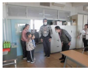
<子供達が活動場所までご案内>