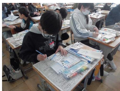
<みんな真剣に作業しています>