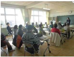
<最初に先生からの活動説明>

子供達は昨年同様、練習を積み重ね、成果発表会を3月9日に行い、成長した姿を再びボランティアさんに見ていただきました。参加して下さったボランティアの皆さん、ありがとうございました！