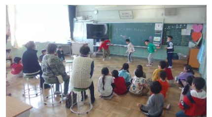
<3/9 成果発表会の様子>