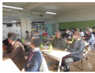
<1/16 参加のボランティアさん>