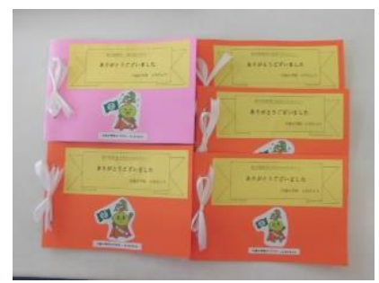
<お礼の手紙を書きました！>